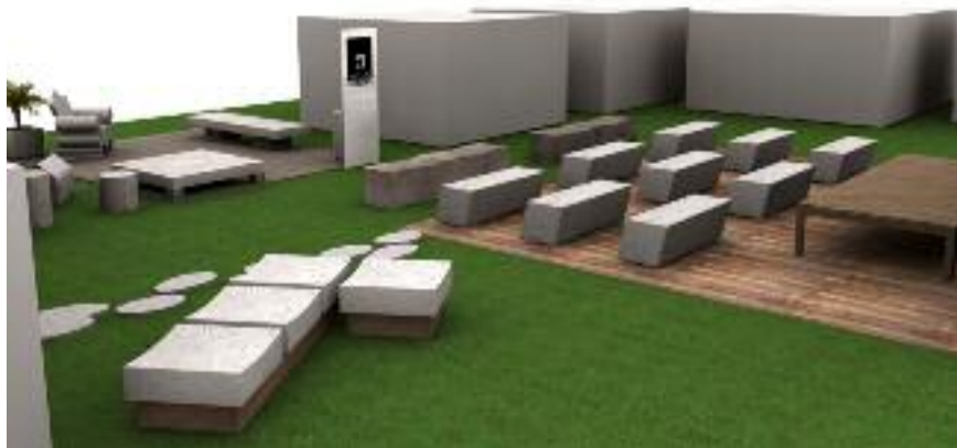
PAD -D3 D 141- 186